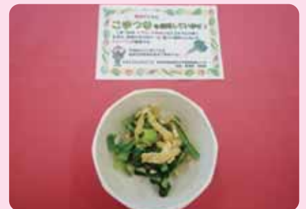
▲今回は特産野菜である「小松菜」についてご紹介します