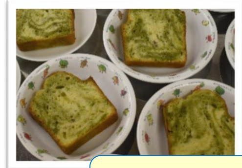
桜と抹茶の パウンドケーキ