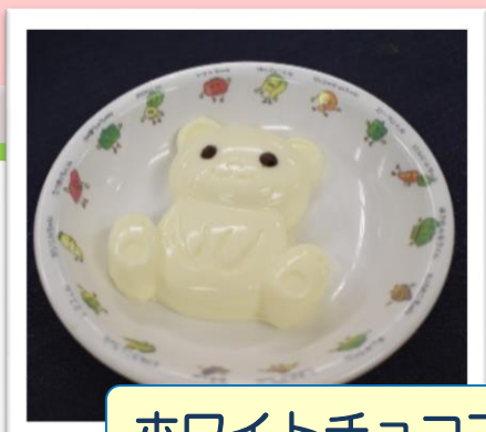
ホワイトチョコプリン