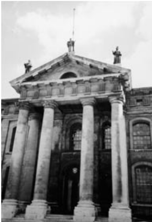
Bodleian Library (英国, オックスフォード)